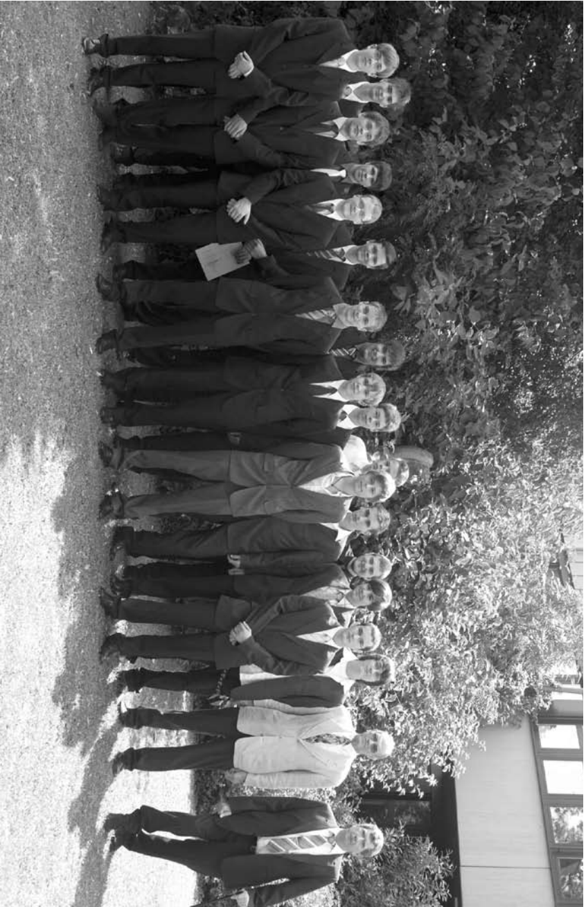
Die 17 Einser-Schüler des Jahrgangs und die Medaillenträger