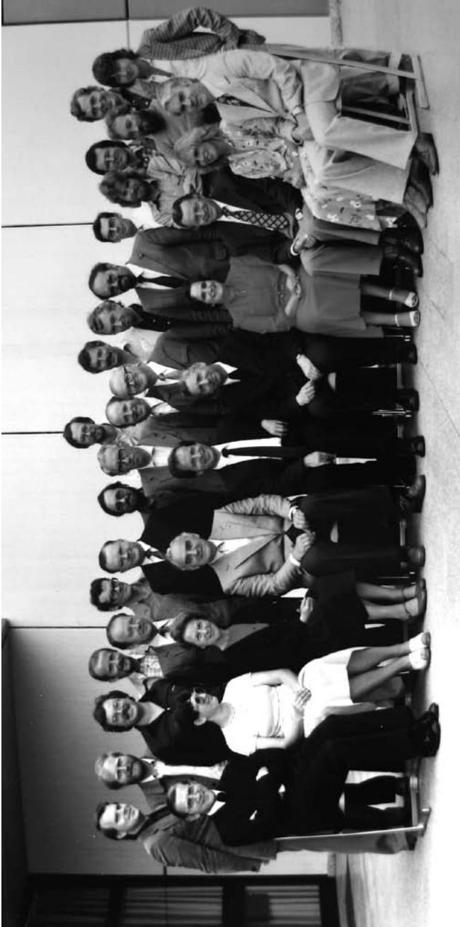
Lehrerkollegium im Schuljahr 1979/80