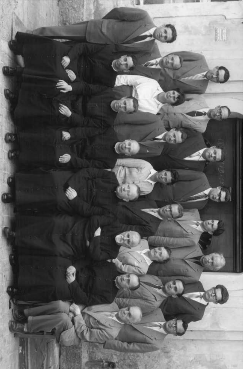
Lehrerkollegium im Schuljahr 1957/58